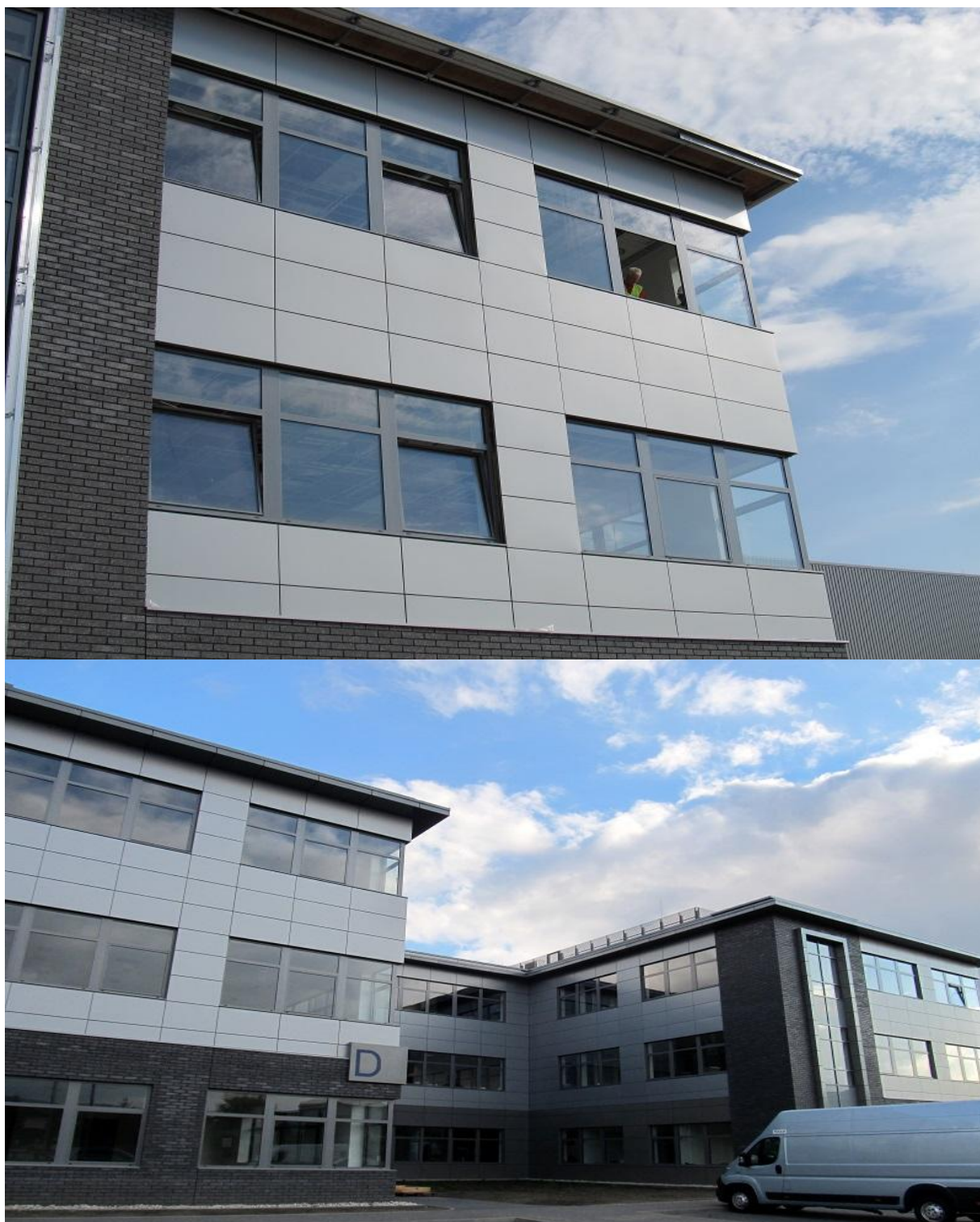
DIAMOND BUSINESS PARK Ursus / Warszawa 2015

ul. Domaniówka 1 C, 25-413 Kielce, POLSKA ul. Warszawska 49 / 44, 25-531 Kielce, POLSKA