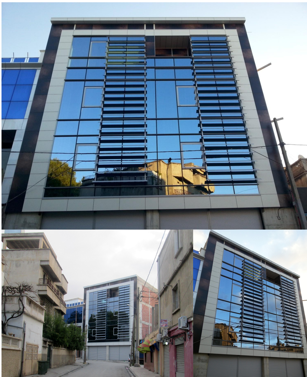
OBIEKT UŻYTKOWY Algieria 2014-2015

ul. Domaniówka 1 C, 25-413 Kielce, POLSKA ul. Warszawska 49 / 44, 25-531 Kielce, POLSKA