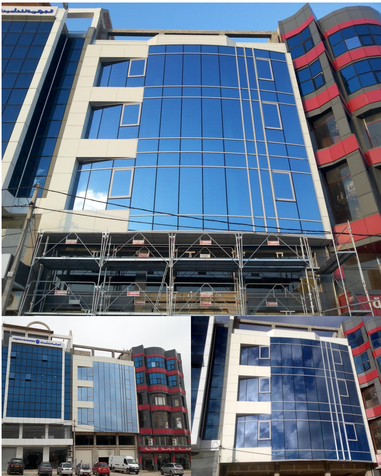
OBIEKT UŻYTKOWY Algieria 2014-2015

ul. Domaniówka 1 C, 25-413 Kielce, POLSKA ul. Warszawska 49 / 44, 25-531 Kielce, POLSKA