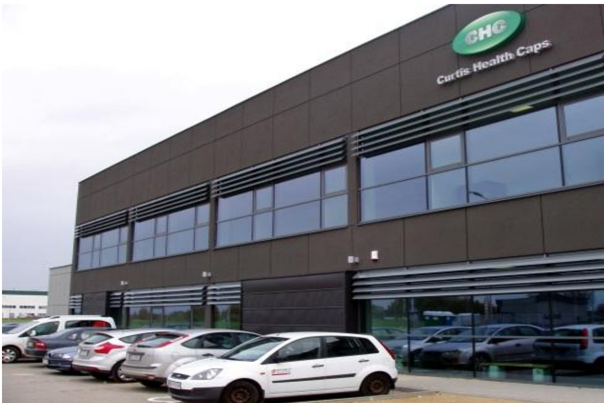
CHC CURTIS HEALTH CUP Wysogotowo / Poznań 2011

ul. Domaniówka 1 C, 25-413 Kielce, POLSKA ul. Warszawska 49 / 44, 25-531 Kielce, POLSKA