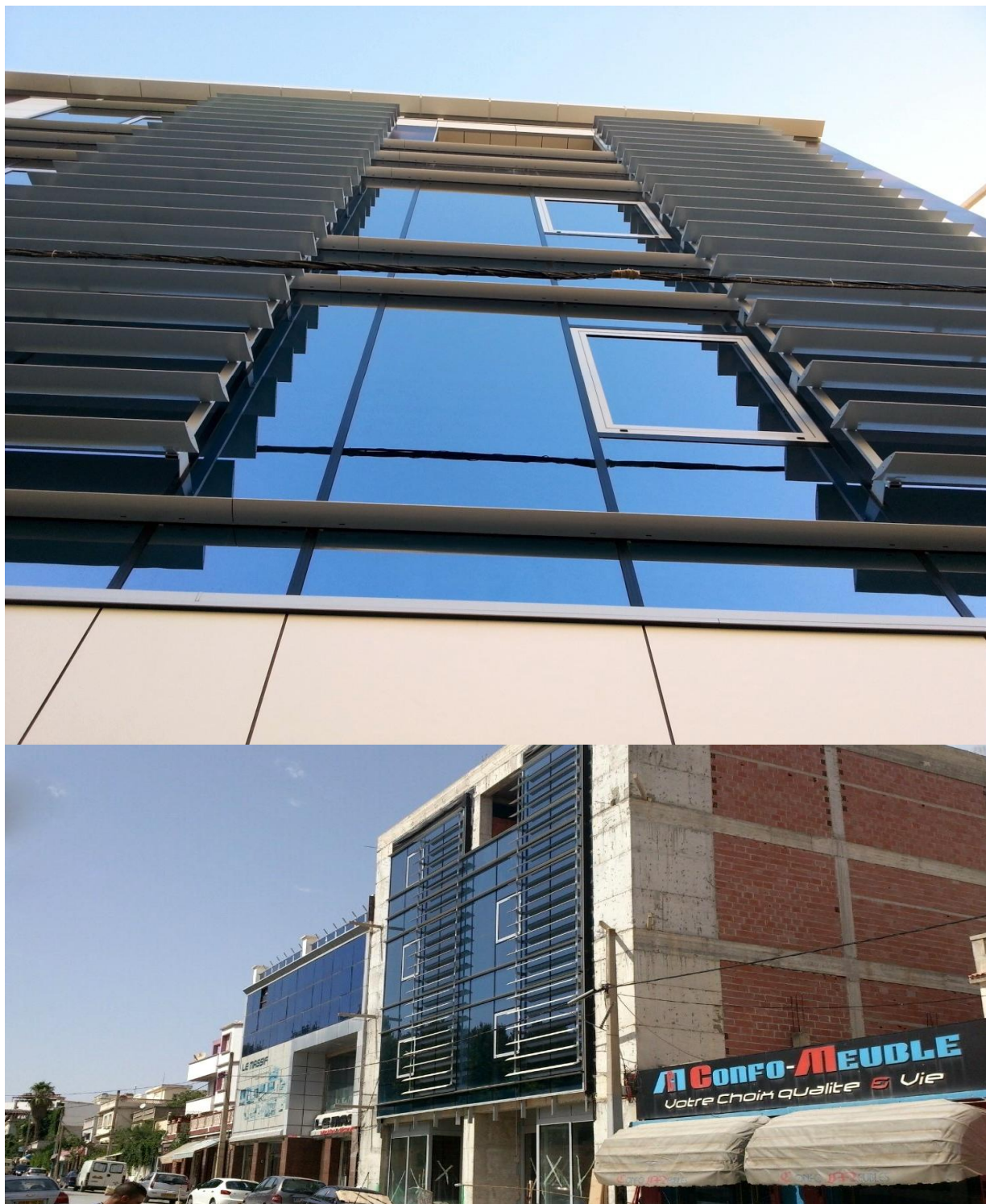
OBIEKT UŻYTKOWY Algieria 2014-2015

ul. Domaniówka 1 C, 25-413 Kielce, POLSKA ul. Warszawska 49 / 44, 25-531 Kielce, POLSKA