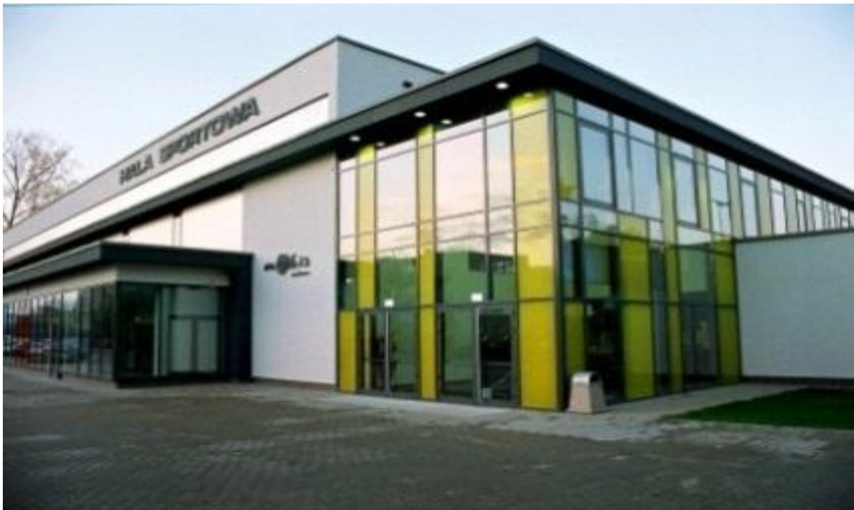
HALA SPORTOWA Oleśnica 2009