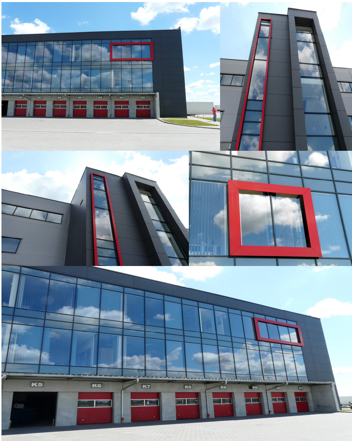
CENTRUM LOGISTYCZNE Łódź 2012

ul. Domaniówka 1 C, 25-413 Kielce, POLSKA ul. Warszawska 49 / 44, 25-531 Kielce, POLSKA