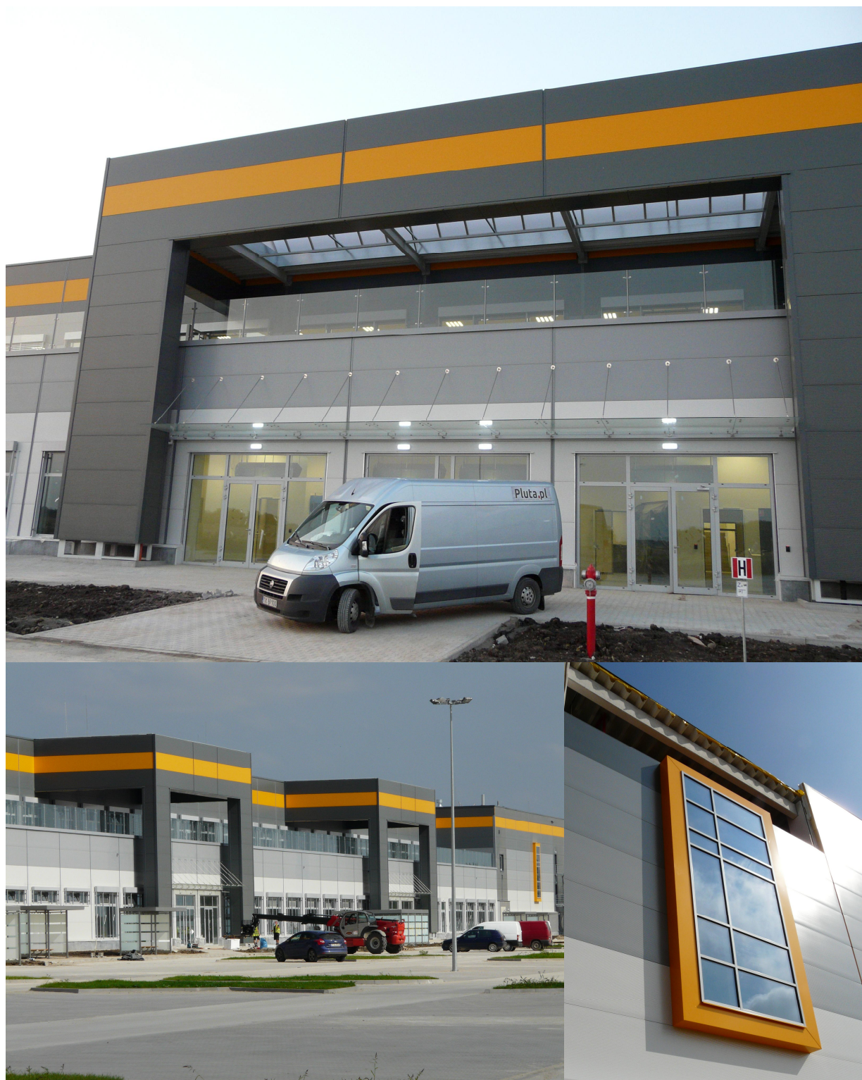
AMAZON Bielany Wrocławskie / Wrocław 2014

ul. Domaniówka 1 C, 25-413 Kielce, POLSKA ul. Warszawska 49 / 44, 25-531 Kielce, POLSKA