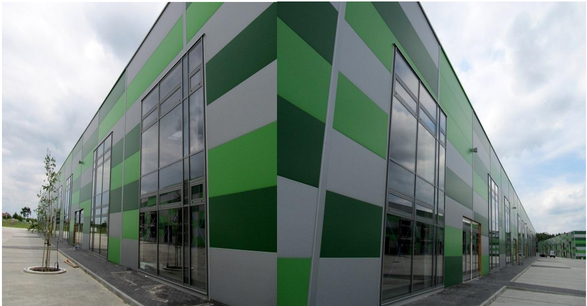
BUSINESS PARK HORYZONT / XL-TAPE INTERNATIONAL Kielce 2013