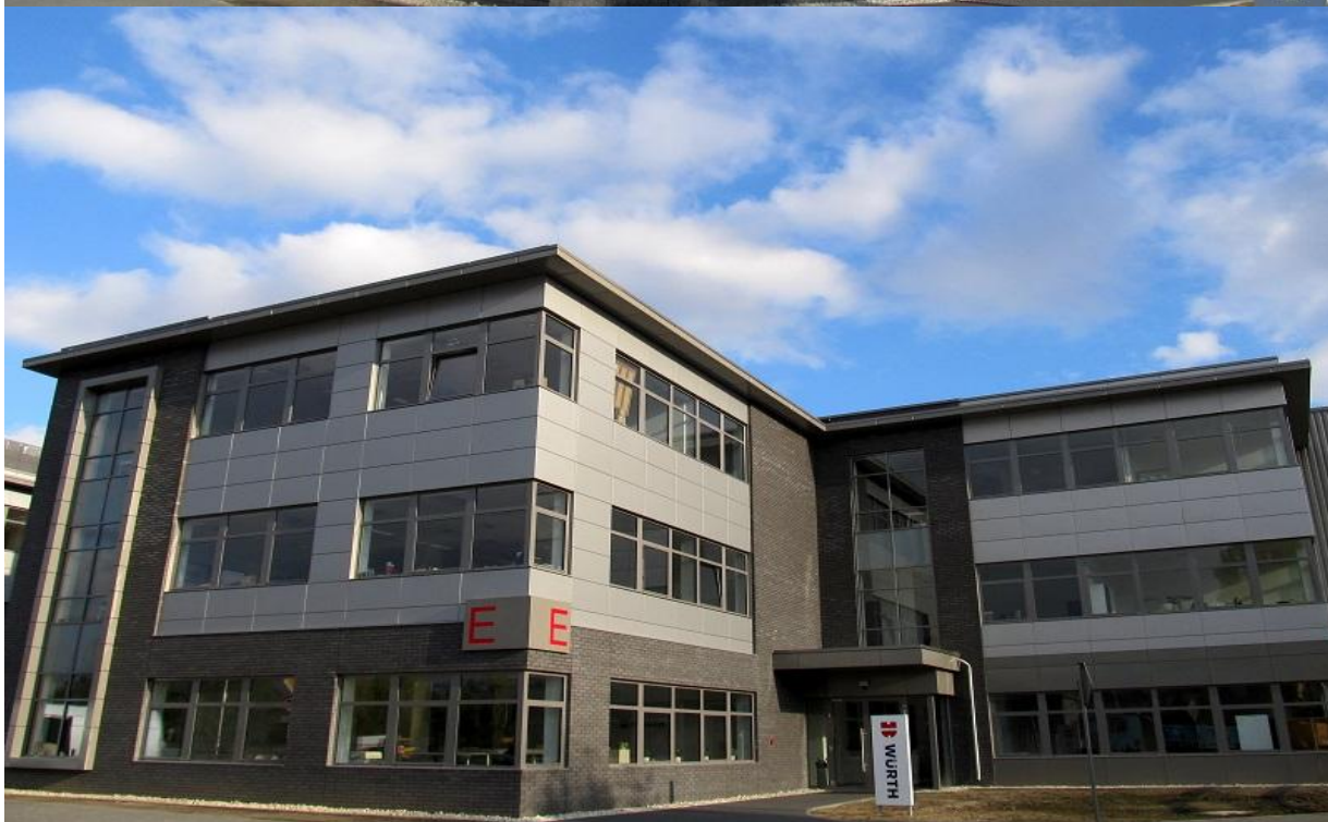
DIAMOND BUSINESS PARK Ursus / Warszawa 2015

ul. Domaniówka 1 C, 25-413 Kielce, POLSKA ul. Warszawska 49 / 44, 25-531 Kielce, POLSKA