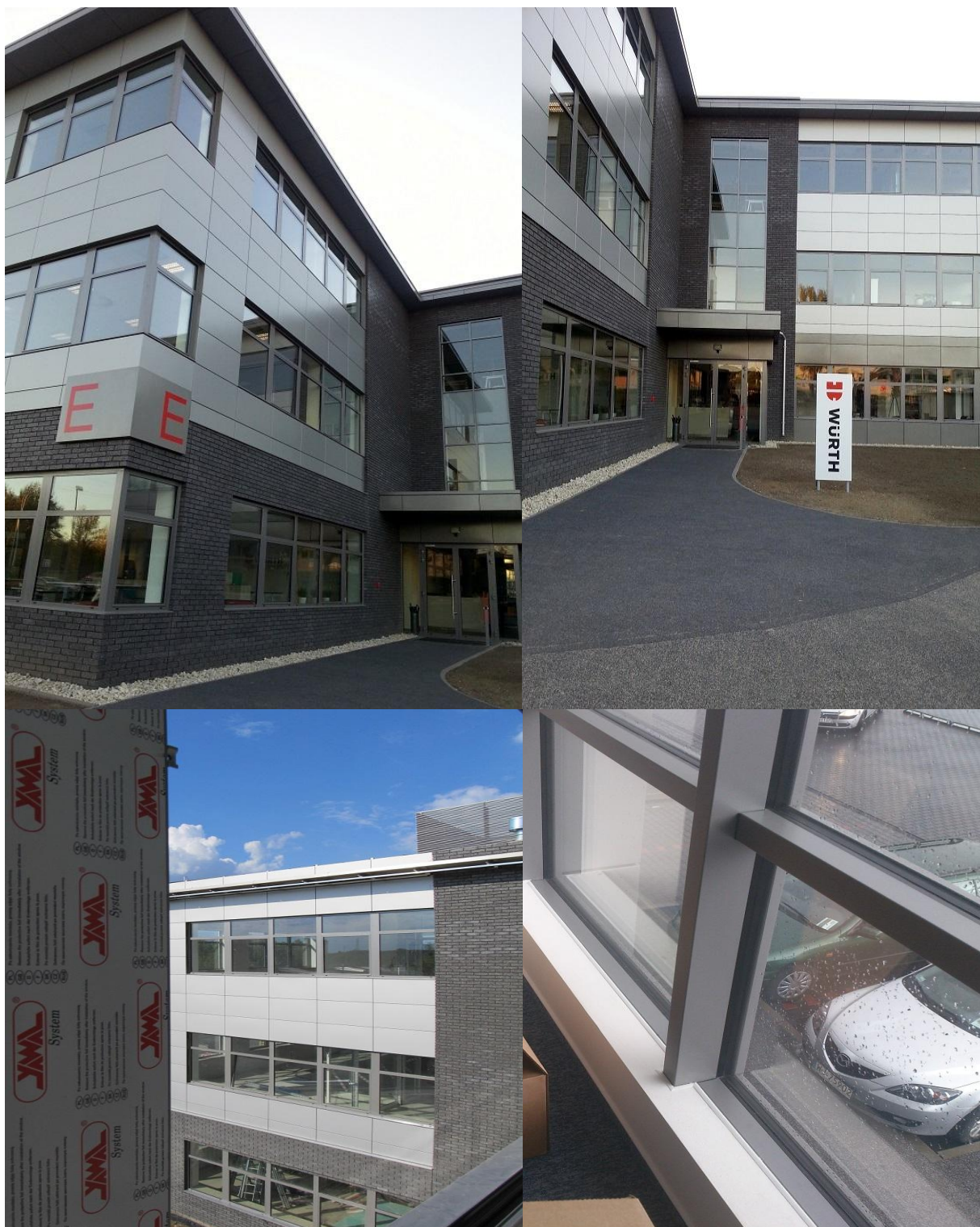
DIAMOND BUSINESS PARK Ursus / Warszawa 2015

ul. Domaniówka 1 C, 25-413 Kielce, POLSKA ul. Warszawska 49 / 44, 25-531 Kielce, POLSKA