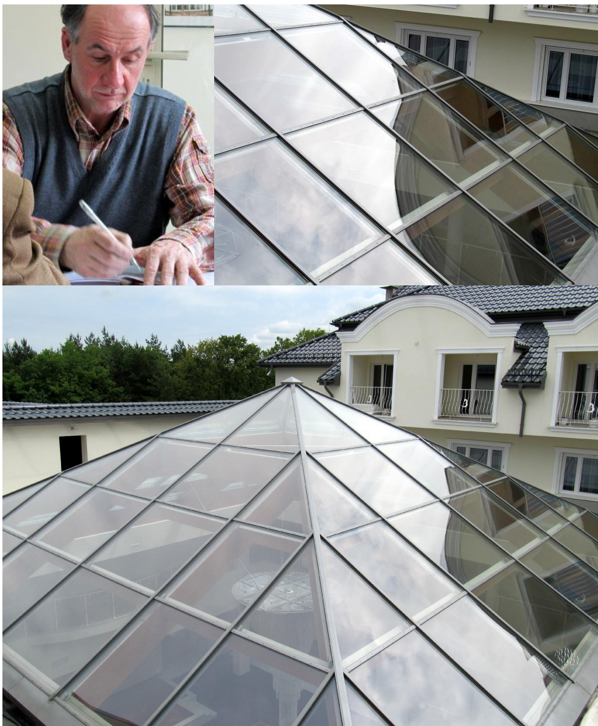
BINKOWSKI HOTEL Kielce 2012-2013

ul. Domaniówka 1 C, 25-413 Kielce, POLSKA ul. Warszawska 49 / 44, 25-531 Kielce, POLSKA NIP 657-000-69-59, REGON 290029792