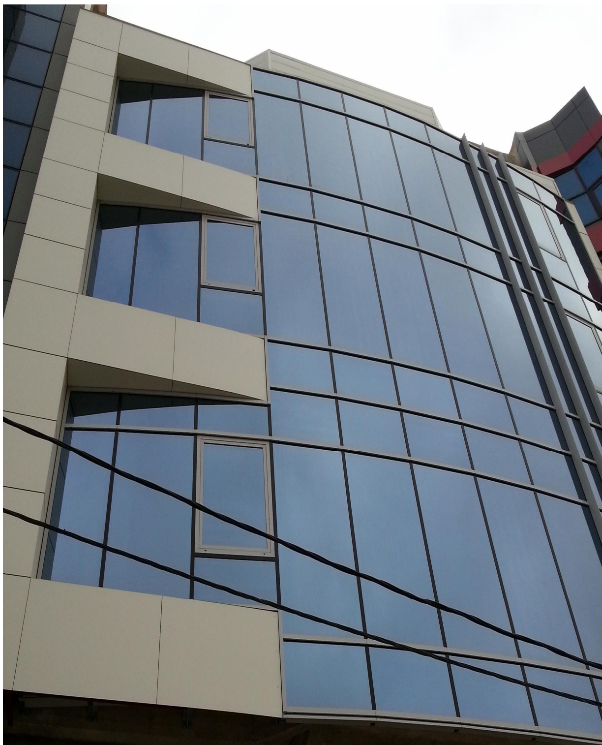
OBIEKT UŻYTKOWY Algieria 2014-2015

ul. Domaniówka 1 C, 25-413 Kielce, POLSKA ul. Warszawska 49 / 44, 25-531 Kielce, POLSKA