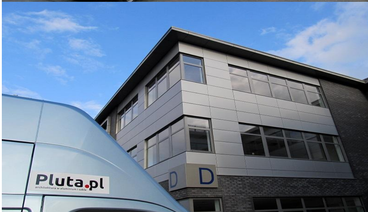
DIAMOND BUSINESS PARK Ursus / Warszawa 2015

ul. Domaniówka 1 C, 25-413 Kielce, POLSKA ul. Warszawska 49 / 44, 25-531 Kielce, POLSKA