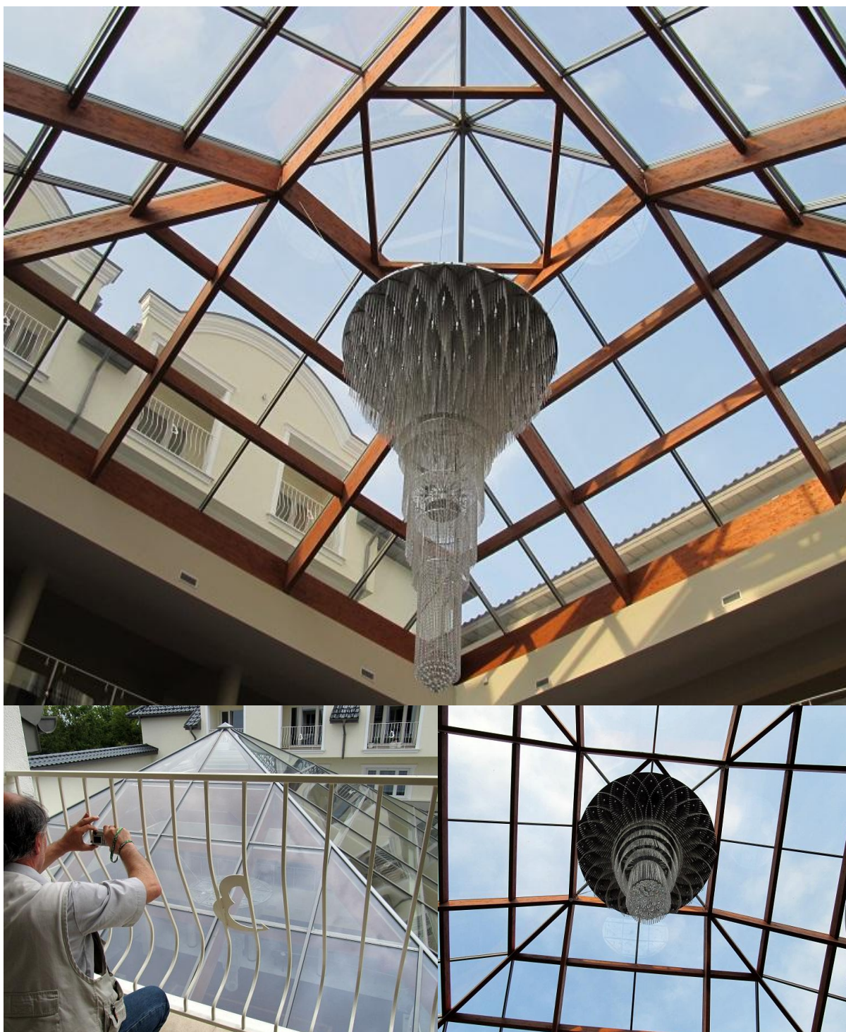
BINKOWSKI HOTEL Kielce 2012–2013

ul. Domaniówka 1 C, 25-413 Kielce, POLSKA ul. Warszawska 49 / 44, 25-531 Kielce, POLSKA