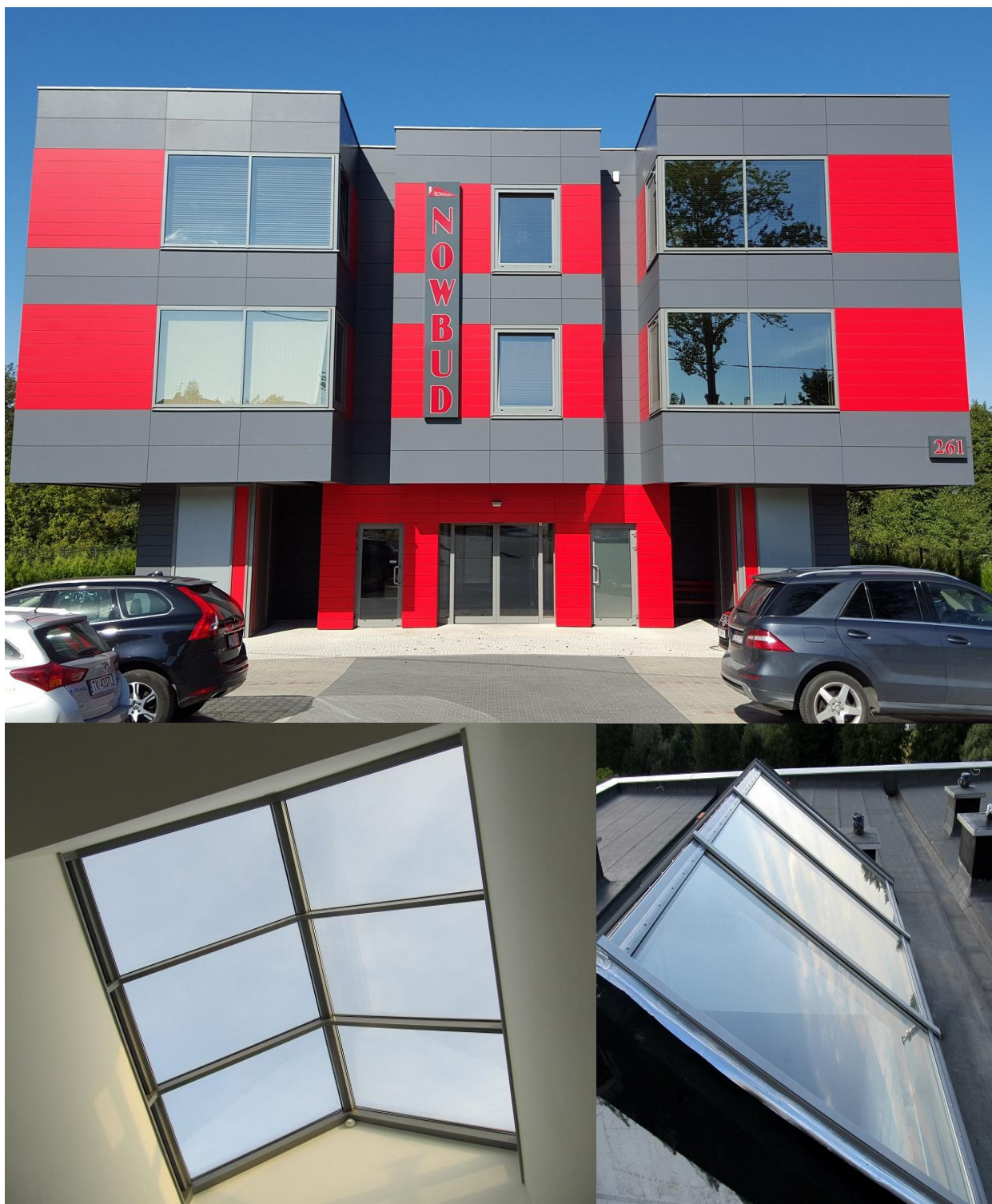
NOWBUD Kielce 2013

ul. Domaniówka 1 C, 25-413 Kielce, POLSKA ul. Warszawska 49 / 44, 25-531 Kielce, POLSKA