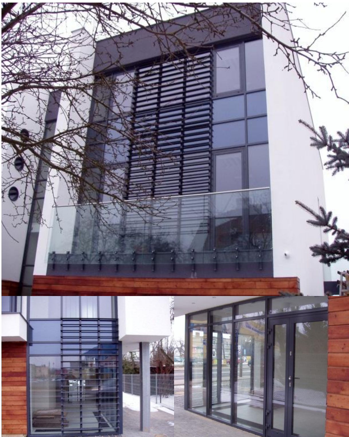
METROLOG Poznań 2012

ul. Domaniówka 1 C, 25-413 Kielce, POLSKA ul. Warszawska 49 / 44, 25-531 Kielce, POLSKA