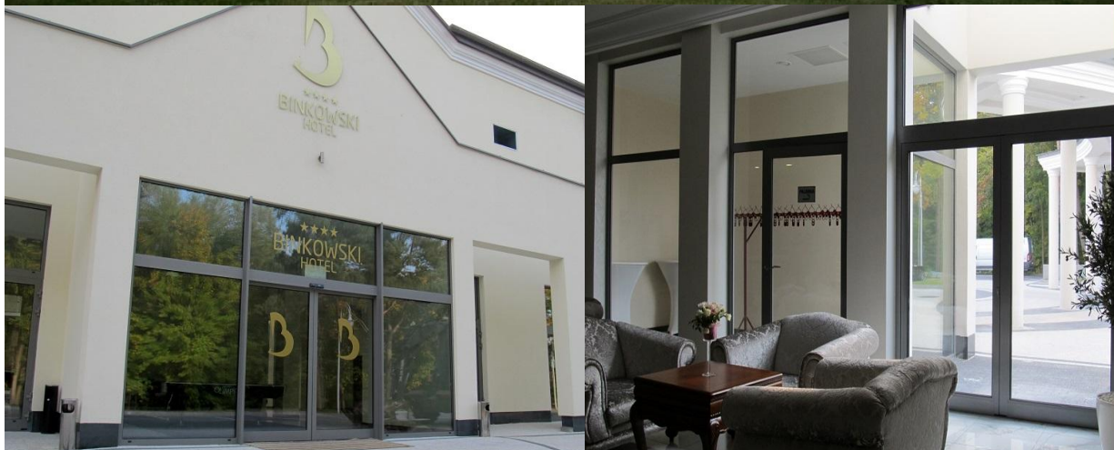
BINKOWSKI HOTEL Kielce 2012-2013

ul. Domaniówka 1 C, 25-413 Kielce, POLSKA ul. Warszawska 49 / 44, 25-531 Kielce, POLSKA