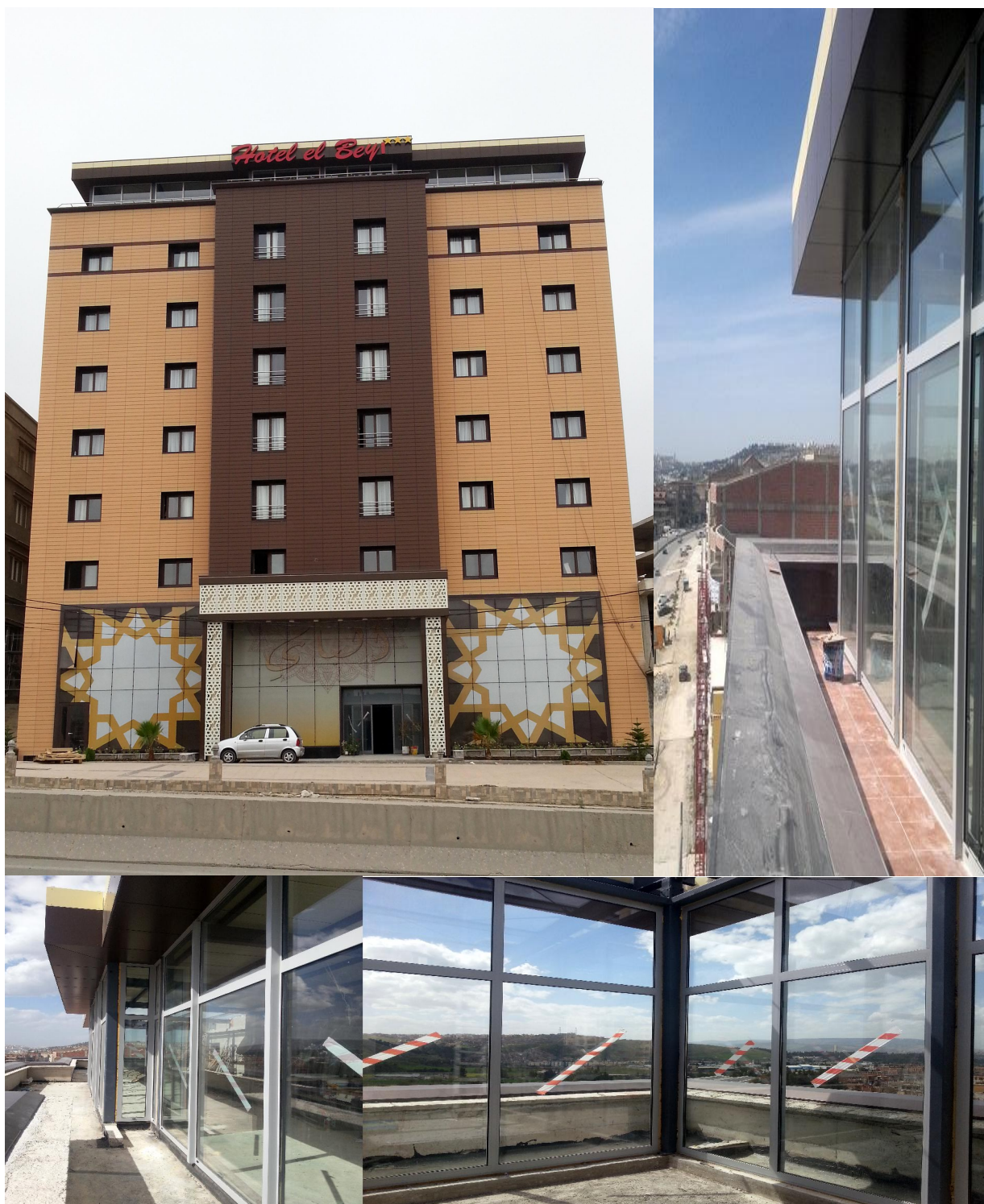
HOTEL Algieria 2014-2015

ul. Domaniówka 1 C, 25-413 Kielce, POLSKA ul. Warszawska 49 / 44, 25-531 Kielce, POLSKA