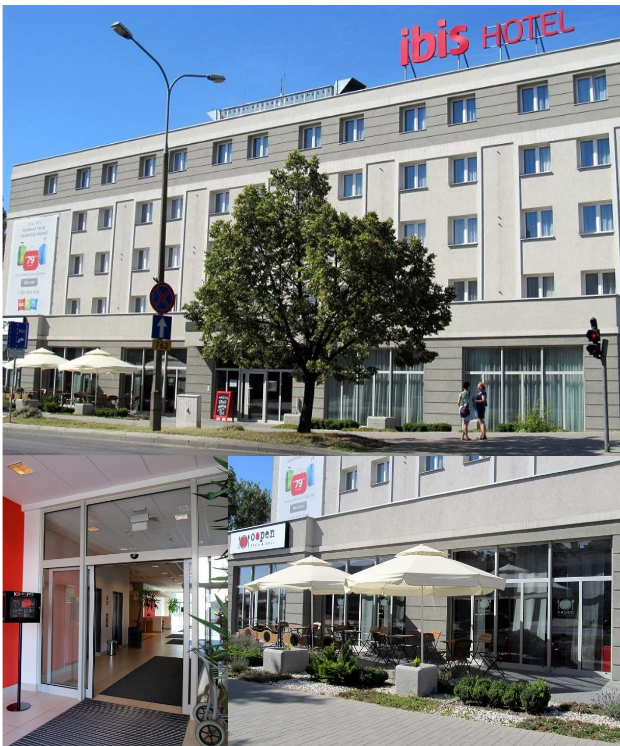
IBIS HOTEL Kielce 2008

ul. Domaniówka 1 C, 25-413 Kielce, POLSKA ul. Warszawska 49 / 44, 25-531 Kielce, POLSKA