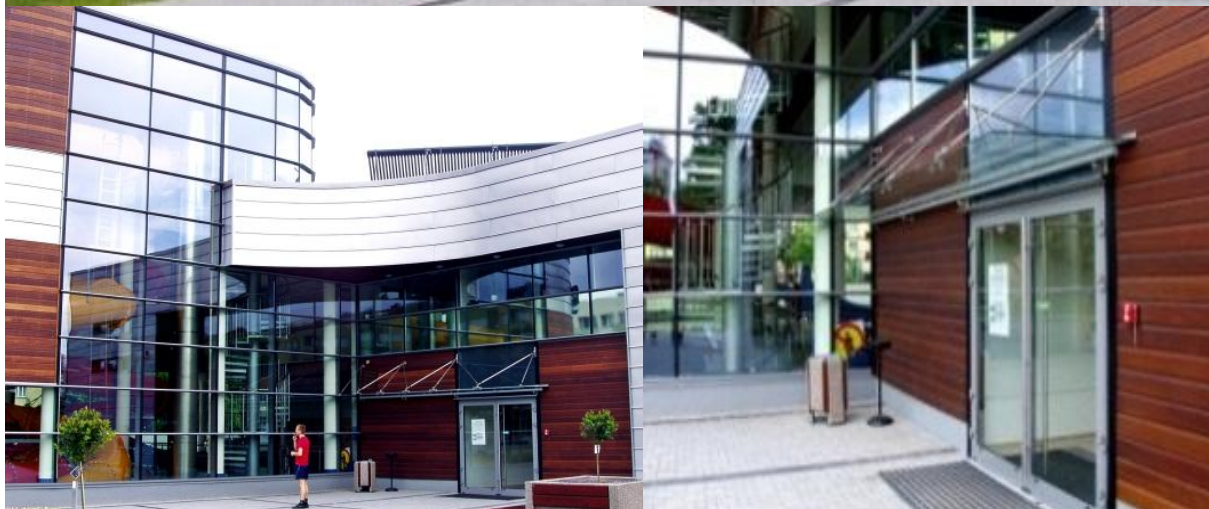
PŁYWALNIA ORKA Bolesławiec 2011

ul. Domaniówka 1 C, 25-413 Kielce, POLSKA ul. Warszawska 49 / 44, 25-531 Kielce, POLSKA