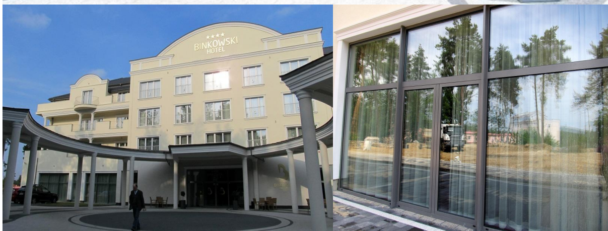
BINKOWSKI HOTEL Kielce 2012-2013

ul. Domaniówka 1 C, 25-413 Kielce, POLSKA ul. Warszawska 49 / 44, 25-531 Kielce, POLSKA