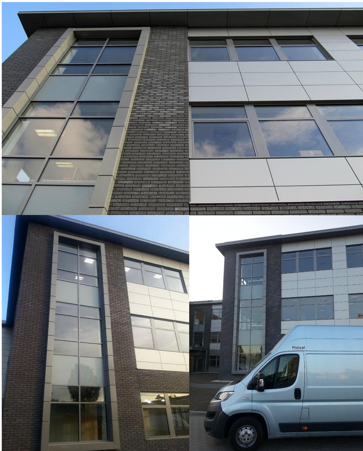
DIAMOND BUSINESS PARK Ursus / Warszawa 2015

ul. Domaniówka 1 C, 25-413 Kielce, POLSKA ul. Warszawska 49 / 44, 25-531 Kielce, POLSKA