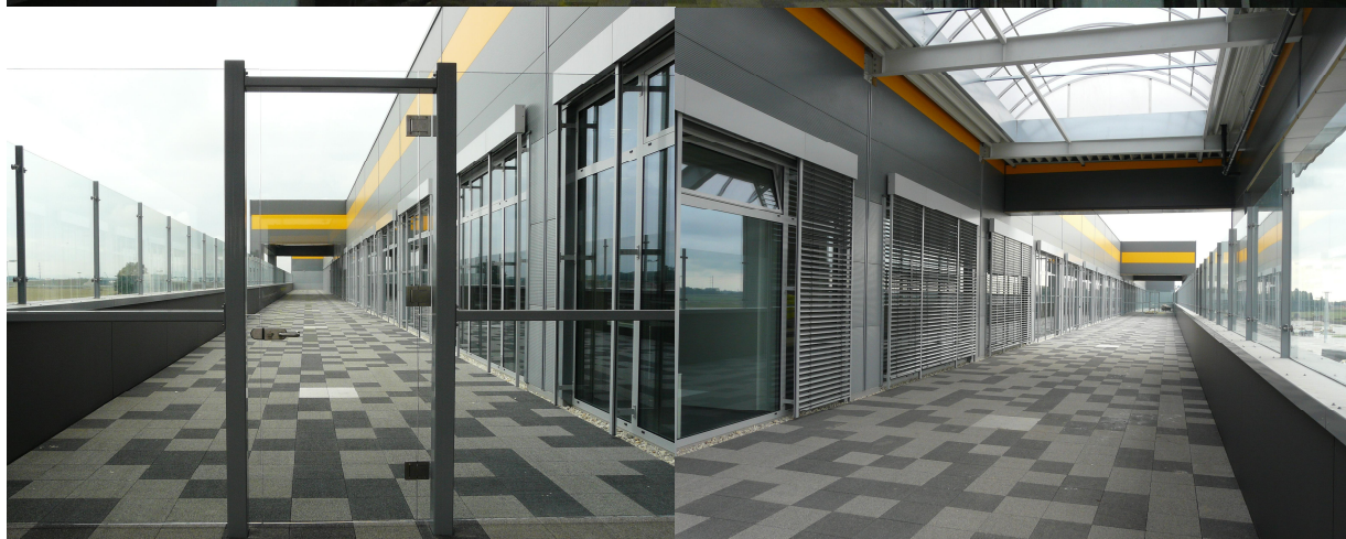
AMAZON Bielany Wrocławskie / Wrocław 2014

ul. Domaniówka 1 C, 25-413 Kielce, POLSKA ul. Warszawska 49 / 44, 25-531 Kielce, POLSKA